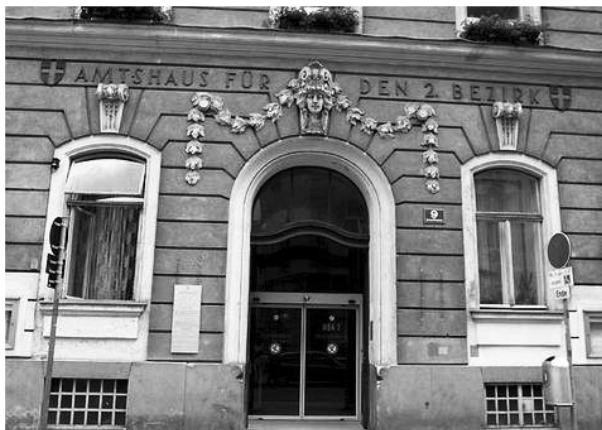
Geht es nach der SPÖ, heißt es "Ende der Debatte" in der Bezirksvertretung Leopoldstadt.

"Mit Dank und Ankerkennung reagierte Bürgermeister Dr. Michael Häupl auf die Präsentation der Unterstützungsleistungen des Österreichischen Bundesheeres im Rahmen der Fußball-EM 2008. In Wien stehen unter anderem an jedem Spieltag 400 Soldatinnen und Soldaten [...] im Einsatz [...]. Der Gegenwert der gesamten Unterstützungsleistungen im Bundesland Wien beträgt 1,18 Millionen Euro [...]. Bis zu 3000 Soldatinnen und Soldaten werden in ganz Österreich im Rahmen der Fußball-EM im Einsatz sein."