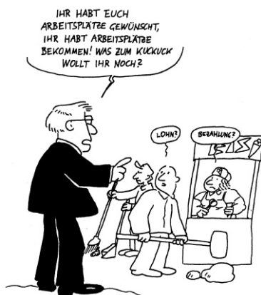
(c) www.zeichenware.at/Karl Berger

ungekürzt erschienen in: AUGUSTIN Nr. 227, 05/2008, Abdruck mit freundlicher Genehmigung der AUGUSTIN-Redaktion