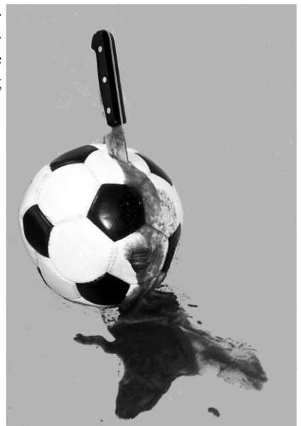
Das erste Opfer: so grausam ist die Alko-Ida!

Wir denken, dass das Ganze nicht wirklich ernst genommen werden kann, werden aber genau beobachten, ob es tatsächlich zu den Übergriffen dieser Alko-ida kommt und hoffen, dass UEFA und PolitikerInnen nicht vor Schrecken den ganzen zweiten Bezirk zu einer Hochsicherheitszone umwandeln. ■